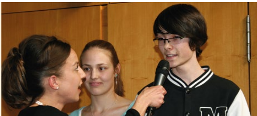
Gesamttiroler Fremdsprachenwettbewerb 2014 in Brixen: Glücklicher Sieger im Interview