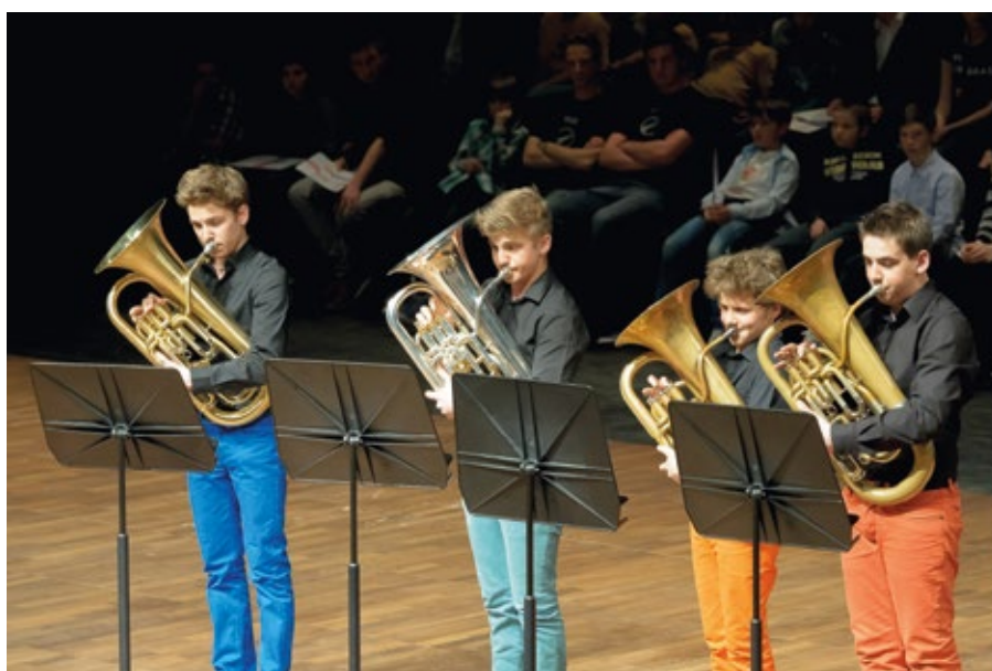
EUPF4fun beim Vortrag auf der Abschlussveranstaltung beim Landeswettbewerb 2014 in Erl