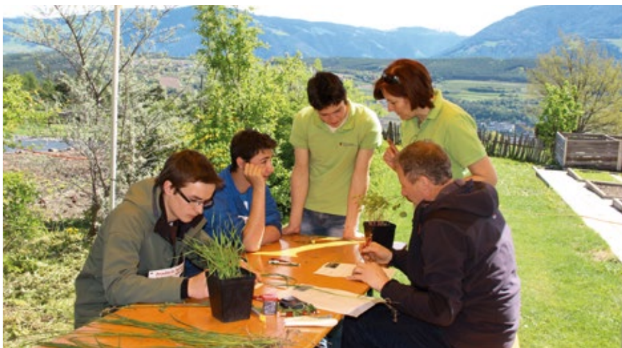
Alpiner Fachwettbewerb der Landwirtschaftsschulen der Europaregion Tirol am 29. April 2014 in der Fachschule Salern